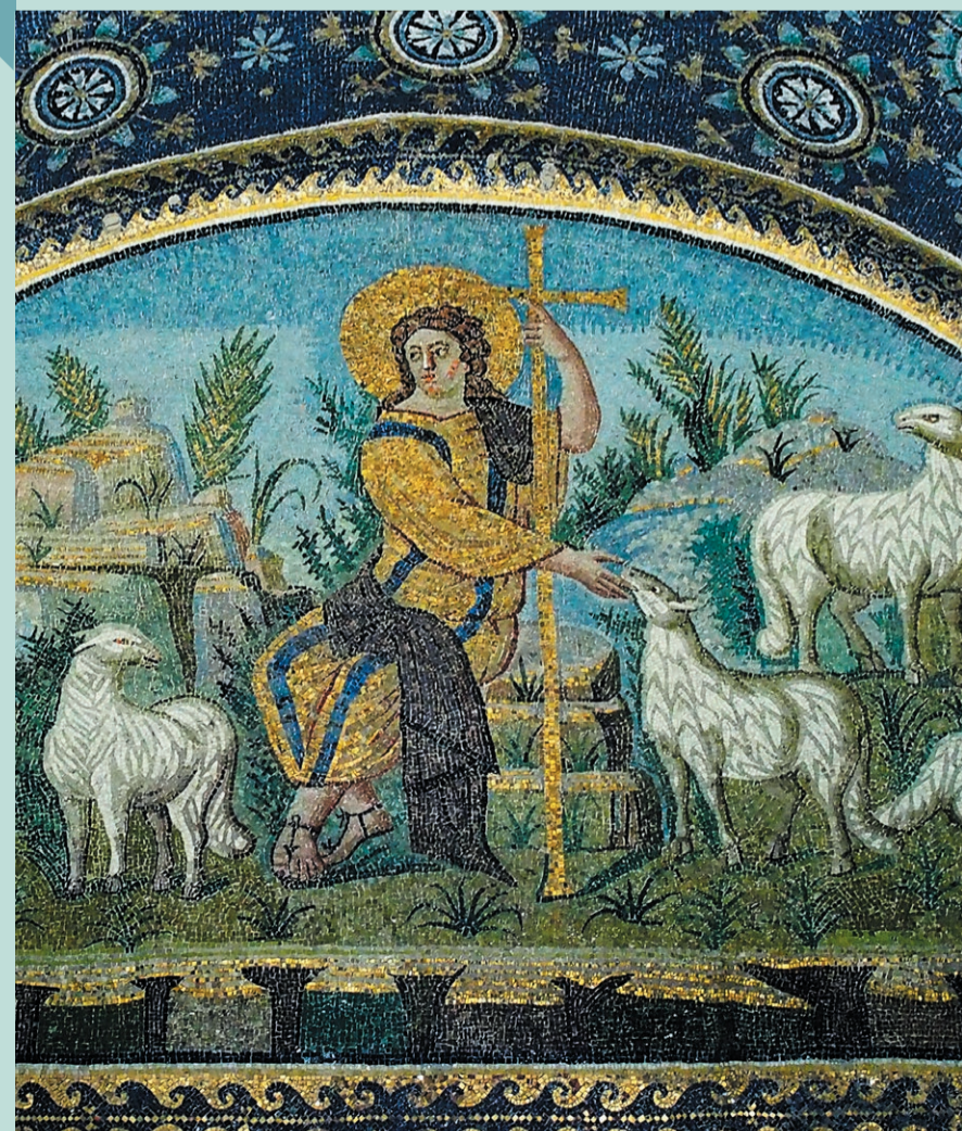
Mausoleum der Galla Placidia, Ravenna (5. Jh.)

+124 Text und Melodie: Lothar Kosse 2004 Impuls: Frieder Dehlinger